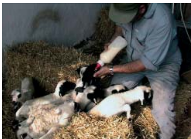
Χορήγηση πρωτογάλακτος με μιμιπερό

τικά με οροαρνητικά ζώα στο ίδιο ποίμνιο. Η επαφή μεταξύ των προβατινών και των αρνιών αποτελεί σοβαρό προδιαθέτονα παράγοντα για τη μετάδοση στο νεογέννητο.