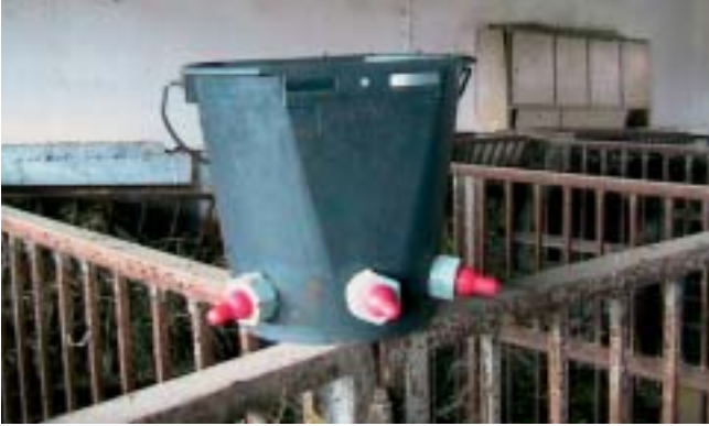
Κουβάς με θήλαστρα

σου μέσω της μεταφοράς εμβρύων που συλλέγονται από οροθετικές μητέρες και μεταφέρονται σε οροαρνητικές δεν είναι δυνατή. Δεδομένα για την ύπαρξη του ιού στα ωάρια δεν είναι διαθέσιμα.