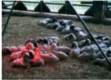
Αρνιά που μεγαλώνουν με τεχνητό θηλασμό κατά τη διάρκεια εφαρμογής προγράμματος εξυγίανσης από την προϊούσα πνευμονία

Κατά την πρώτη προσπάθεια εξυγίανσης από την προϊούσα πνευμονία που έγινε στο Ινστιτούτο Κτηνοτροφίας του ΕΘΙΑΓΕ, η χορήγηση πρωτογάλακτος γινόταν με ένα πολύπλοκο και δύσκολο να εφαρμοσθεί στην πράξη σχήμα. (Α)