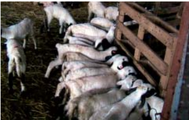
Χορήγηση γάλακτος με θηλαστική μηχανή

το λεντοϊό των προβάτων. Ακριβή δεδομένα δεν είναι διαθέσιμα επειδή τυποποιημένες μέθοδοι για τον υπολογισμό της γαλακτοπαραγωγής είναι λιγότερο συνηθισμένες στα μικρά μηρυκαστικά σε σύγκριση με τα γαλακτοπαραγωγά βοοειδή. Θα πρέπει να σημειωθεί ότι η μείωση στη γαλακτοπαραγωγή επηρεάζεται επίσης από τη διαχείριση και τη διατροφή των ζώων. Η προσβολή από προϊούσα πνευμονία είναι δυνατό να επηρεάσει αρνητικά την ποιότητα του γάλακτος (αύξηση του αριθμού των σωματικών κυττάρων). Ως καταναλωτές απαιτούμε προϊόντα από ζώα με την καλύτερη δυνατή κατάσταση υγείας. Τα ζώα με προϊούσα πνευμονία δεν ανταποκρίνονται σε αυτή την απαίτηση.